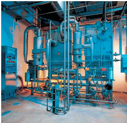
Выпарная установка AlfaVar