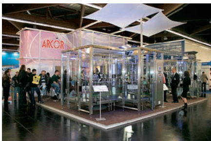
Оборудование для розлива компании Arcor GmbH

роне. Каждый пластинчатый теплообменник собран на станине.